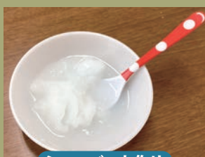
シャーベット作り