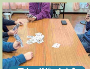
アナログゲーム大会