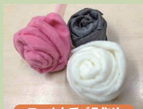
フェルトでバラ作り